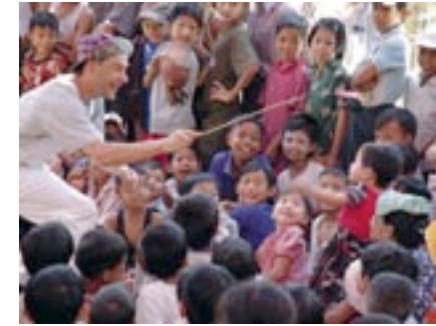
Clowns sans frontières Birmanie

– La France, c'est aussi un combat, au premier rang desquels celui pour la diversité culturelle, qui a fait l'objet d'une convention signée en 2005 à Paris par plus de 140 pays dans le monde... Une manière de justifier les mesures fortes et protectrices de ces vingt dernières années : prix unique du livre, quotas pour la chanson, avance sur recettes pour le cinéma... Autant de mesures qui ont permis de garder de bonnes parts pour le marché national (50 à 60% pour notre cinéma, 60 millions d'entrées dans le monde...).