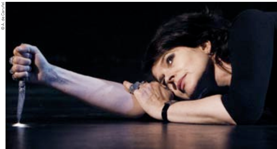
Fanny Ardant dans La Maladie de la mort de Marguerite Duras septembre 2006, Montréal

Chers amis américains, chers lecteurs de l'édition (européenne) de l'hebdomadaire Time ,