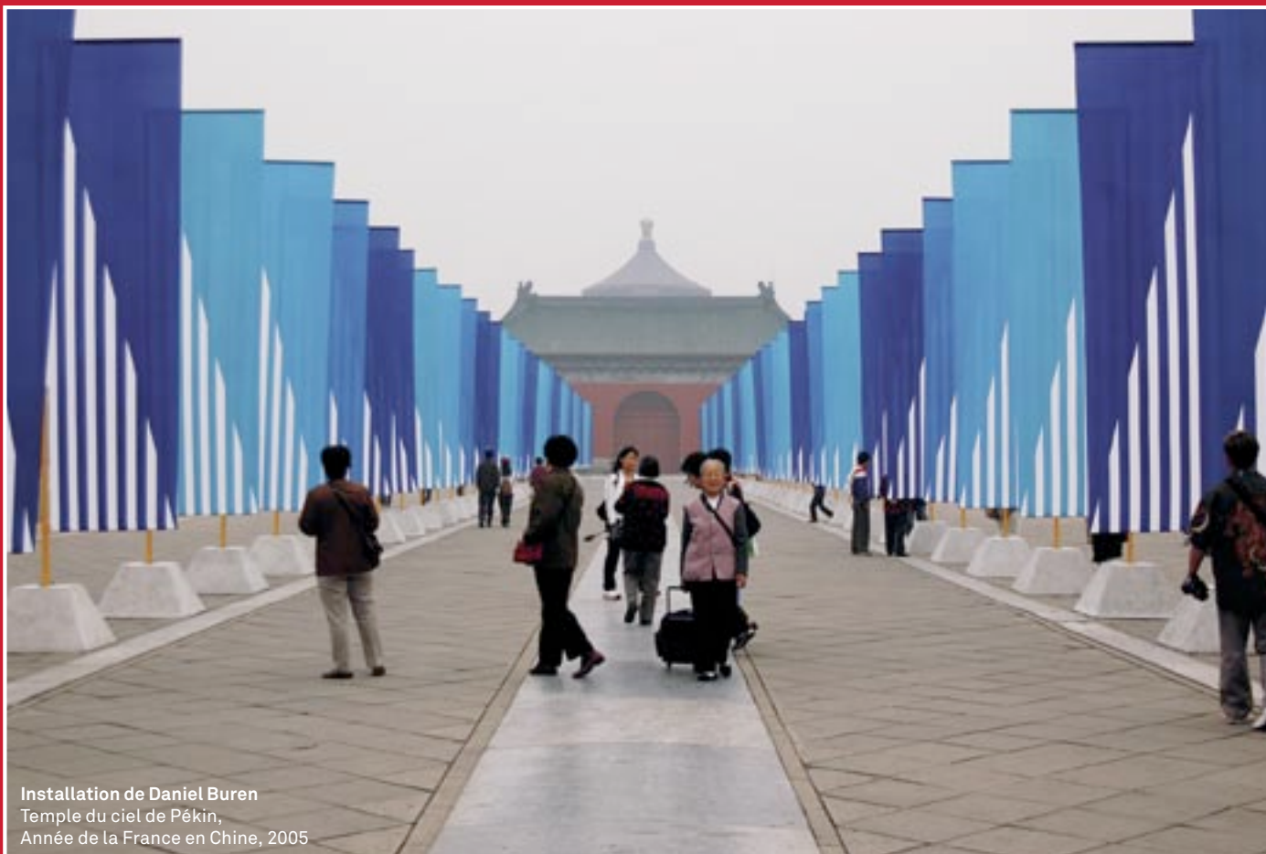
Installation de Daniel Buren Temple du ciel de Pékin, Année de la France en Chine, 2005