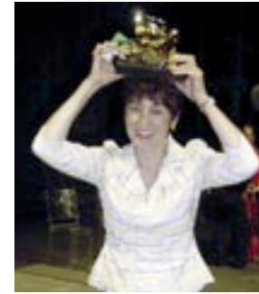
Annette Messenger Lion d'or à Venise en 2005

Depuis quelques semaines, tous les arguments, à dire vrai, ont été jetés sur la table de discussion (à supposer qu'il y ait encore matière à débat, pour vous, chers amis américains). Par exemple :