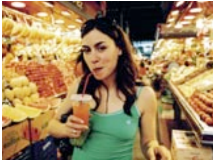
Olivia Ruiz nouveau talent de la chanson française

– While our creators and intellectuals lost some ground in the United States after the war, we are now seeing their return, and