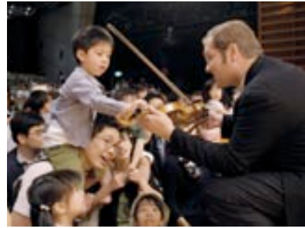
La Folle Journée à Tokyo mai 2007

Admittedly, Time's gift was unexpected. Giving such prominence to French culture in its readers' minds rather than issues of worldwide interest. Our fifteen minutes of fame! The chance to remind our fellow countrymen that nothing can be taken for granted, that it is necessary to fight, including at home, to reaffirm the importance of this culture, the power of our influence.